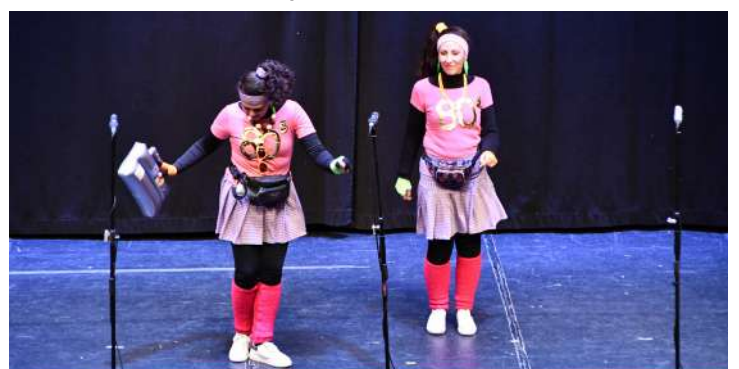
Pareja “Las Ochenteras”, 1º en disfraz