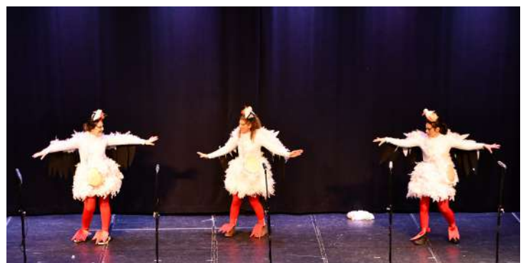
Grupo “Las Ciconias Modernas”, 2º en disfraz