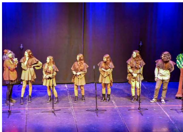
Grupo “Ni Fu ni Fa” , 2º en disfraz