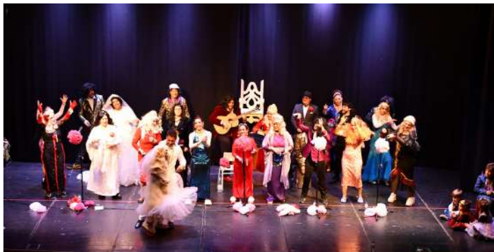
“Jarana”, 1ª en canción

En el disfraz de grupos el ganador fue “Las Revoltosas”, las segundas “Las Ciconias Modernas” y en tercer lugar “Atracciones al Pelo”. En parejas “Las Ochenteras” fueron las ganadoras.