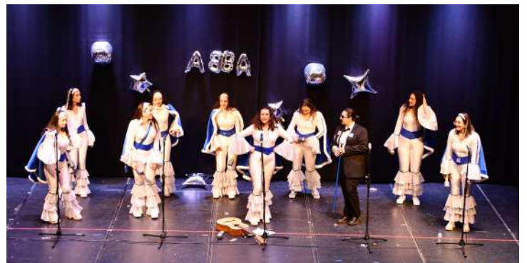
“Qué Kilombo”, 3ª en canción y 2ª en disfraz