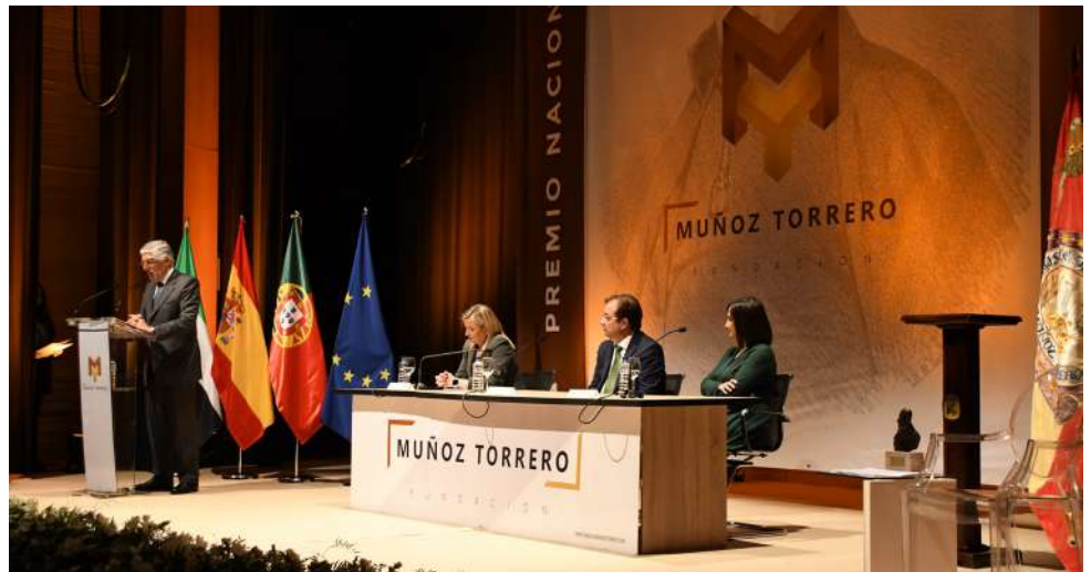
Acto de la Fundación Muñoz-Torrero

El plazo de presentación de solicitudes está abierto hasta el día 28 de junio a las 14h.