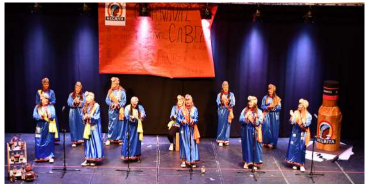
“Las Chochis”, 1ª en disfraz