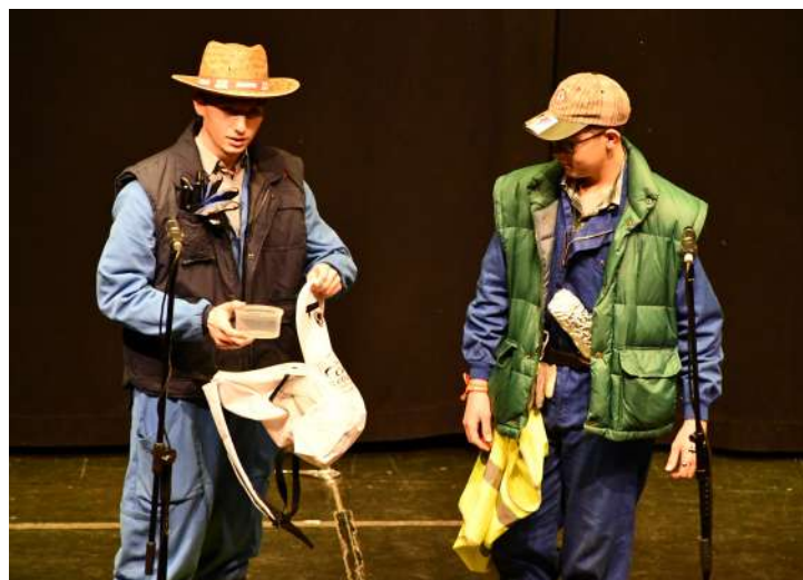
Pareja “Los Galácticos del Campo” , 1º en disfraz