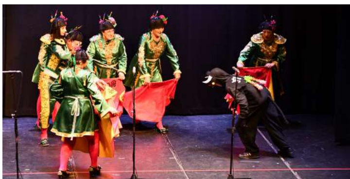
Grupo “Las Revoltosas”, 1º en disfraz