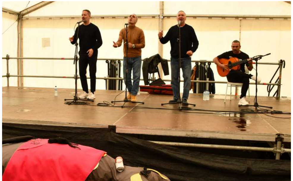
Cuarteto "Pa Piratas, nosotros"

El martes de Carnaval se caracterizó por un día con gran ambiente y sobre todo con muy buen tiempo que hizo que muchas personas salieran a la calle al ser día festivo. A mediodía en la carpa pudimos disfrutar de las canciones del cuarteto gaditano "Pa piratas, nosotros". Después, miembros de diferentes grupos y murgas hicieron la corona y volvieron a leerse las trincaventuras siempre relacionadas con algún tema o personalidades del pueblo. Por la tarde, y con gran afluencia de público, la sardina, elaborada con material no contaminante, salía en un riguroso desfile procesional portada por jóvenes participantes que bailaban a ritmo de la Charanga Q´Show. Al llegar a la Plaza de la Fuente, y como viene siendo habitual, se bailó y se procedió a la quema de la sardina.