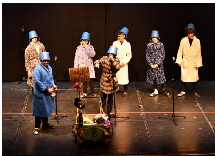
Grupo “Los Piraillos” , 1º en disfraz