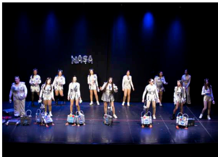
Murga “Las Petazetas” , 1ª en canción y 1ª en disfraz

los primeros y “Ni fu ni Fa” quedaron en segundo lugar. En parejas los ganadores fueron “Los galácticos del campo”.