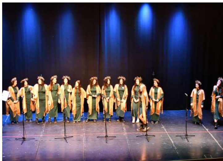
Murga “Las Gorgonas” , 3ª en disfraz