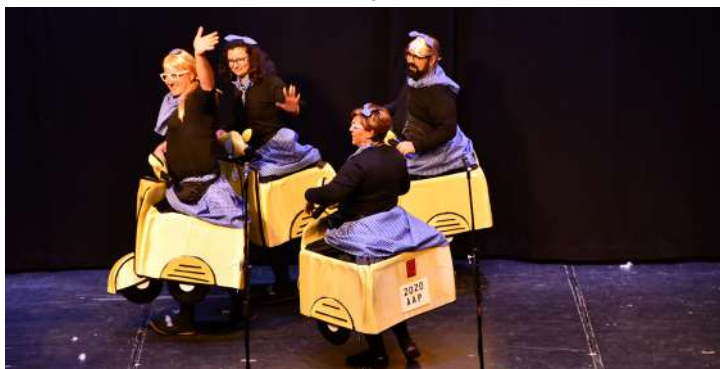
Grupo “Atracciones al Pelo”, 3º en disfraz