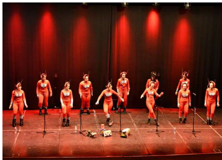
Murga “Las Susilú” , 2ª en canción y 2ª en disfraz